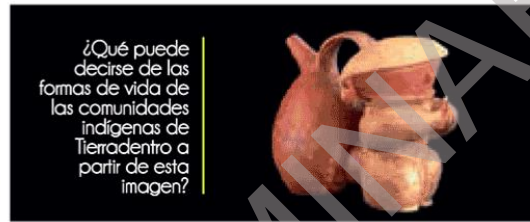
Alcaraza silbante - Tierradentro. Museo del Oro en línea (Junio de 2015). http://www.banrepocultural.org/museo-del-oro/patrimonio-arqueologico

4 Realiza un análisis sobre los bienes de la cultura (verbal y no verbal) de la región, del país y del mundo para construir significados del entorno. Por ejemplo: